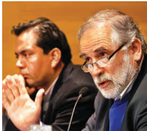
El Senador por Santiago Oriente Carlos Montes encabezó el foro panel "Los Desafíos de la Educación en Chile, realizado por la Facultad de Educación.