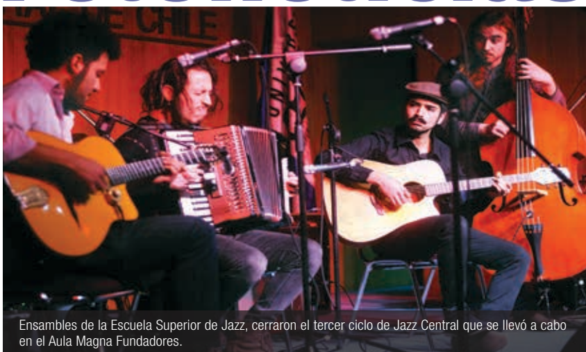
Ensamblés de la Escuela Superior de Jazz, cerraron el tercer ciclo de Jazz Central que se llevó a cabo en el Aula Magna Fundadores.