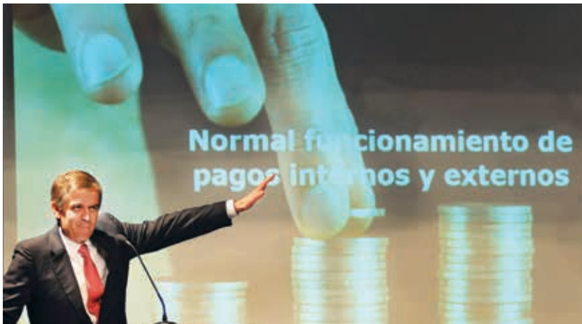
El presidente del Banco Central, Rodrigo Vergara Montes, inauguró el año académico de la Facultad de Ciencias Económicas y Administrativas (FACEA) con una Clase Magistral en la que abordó el rol, objetivos, funciones e instrumentos del ente emisor.