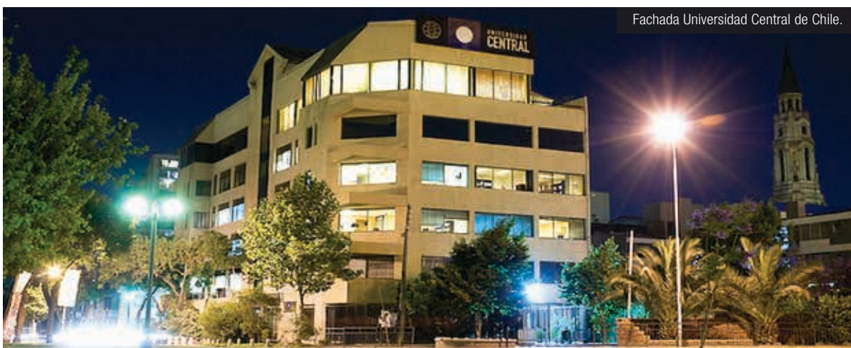
Fachada Universidad Central de Chile.