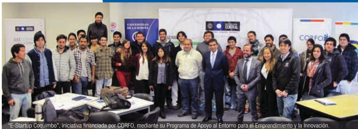
"E-Startup Coquimbo", iniciativa financiada por CORFO, mediante su Programa de Apoyo al Entorno para el Emprendimiento y la Innovación.