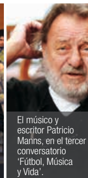
El músico y escritor Patricio Manns, en el tercer conversatorio 'Fútbol, Música y Vida'.

La actividad organizada por el área de Extensión Académica y Cultural de la Dirección de Comunicaciones Corporativas y la Facultad de Comunicaciones, contó con la participación de connotados actores de la escena cultural nacional.