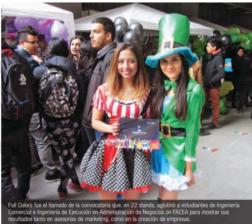
Full Colors fue el llamado de la convocatoria que, en 22 stands, aglutinó a estudiantes de Ingeniería Comercial e Ingeniería de Ejecución en Administración de Negocios de FACEA para mostrar sus resultados tanto en asesorías de marketing, como en la creación de empresas.