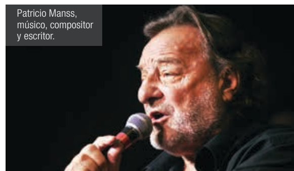
Patricio Manns, músico, compositor y escritor.

de la nueva canción chilena y posterior, dando cuenta del proceso creativo realizado durante toda su vida, cuyo trabajo creativo también incluye la literatura. El concierto estuvo enmarcado por una masiva audiencia, que repletó el Aula Magna Fundadores del Centro de Extensión Hugo Gálvez Gajardo de la casa de estudios centralina, para escuchar las obras de Manns.