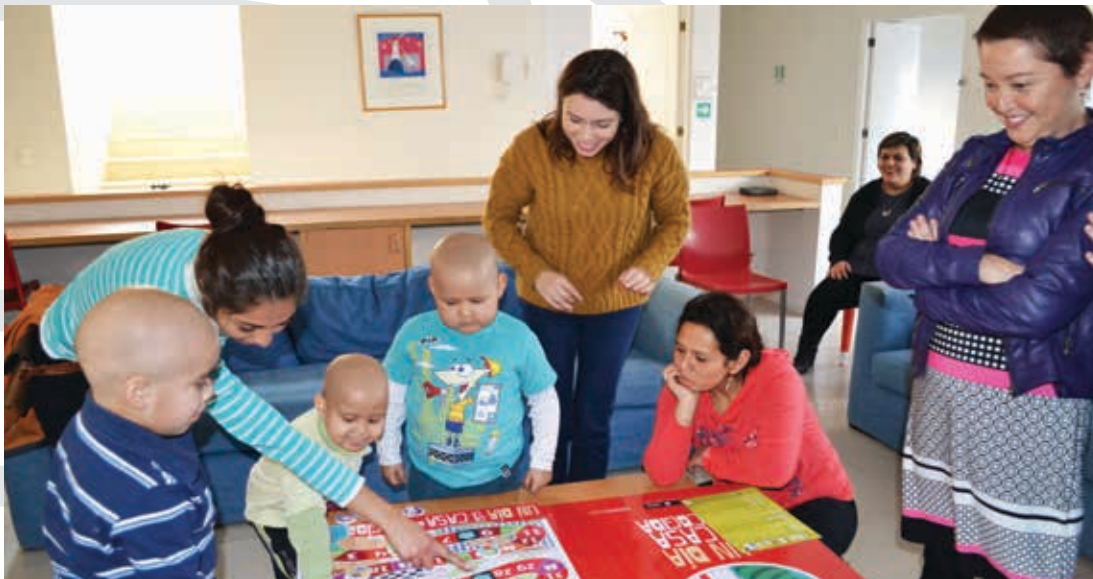
Estudiantes de Terapia Ocupacional de la Facultad de Ciencias de la Salud diseñaron juego didáctico para Fundación Nuestros Hijos.