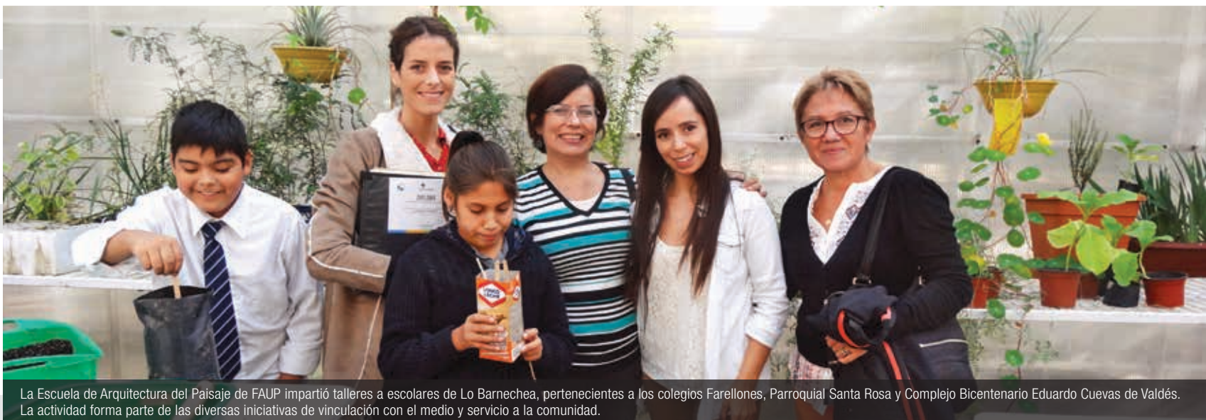
La Escuela de Arquitectura del Paisaje de FAUP impartió talleres a escolares de Lo Barnechea, pertenecientes a los colegios Farellones, Parroquia Santa Rosa y Complejo Bicentenario Eduardo Cuevas de Valdivia. La actividad forma parte de las diversas iniciativas de vinculación con el medio y servicio a la comunidad.