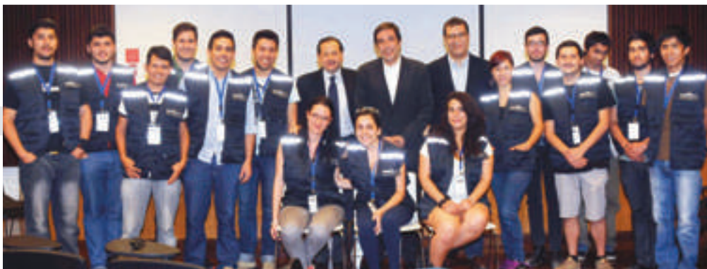
Invitados por la Facultad de Ciencias Políticas y Administración Pública y la Dirección de Relaciones Internacionales de la UCEN, una delegación de observadores electorales de la Universidade Federal da Integração Latino-Americana (UNILA) de Foz do Iguaçu (Brasil), visitaron el centro de cómputos del Servicio Electoral (SERVEL).