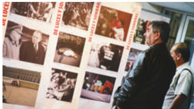
La Facultad de Comunicaciones realizó la exposición fotográfica "Chile 40 años de luces y sombras". La muestra contó con obras de destacados fotógrafos nacionales que retratan distintas épocas e hitos de la historia reciente del país.