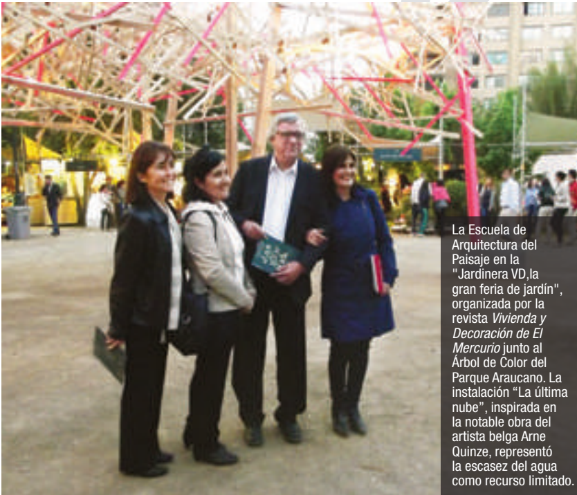
La Escuela de Arquitectura del Paisaje en la "Jardinera VD, la gran feria de jardín", organizada por la revista Vivienda y Decoración de El Mercurio junto al Árbol de Color del Parque Araucano. La instalación "La última nube", inspirada en la notable obra del artista belga Arne Quinze, representó la escasez del agua como recurso limitado.