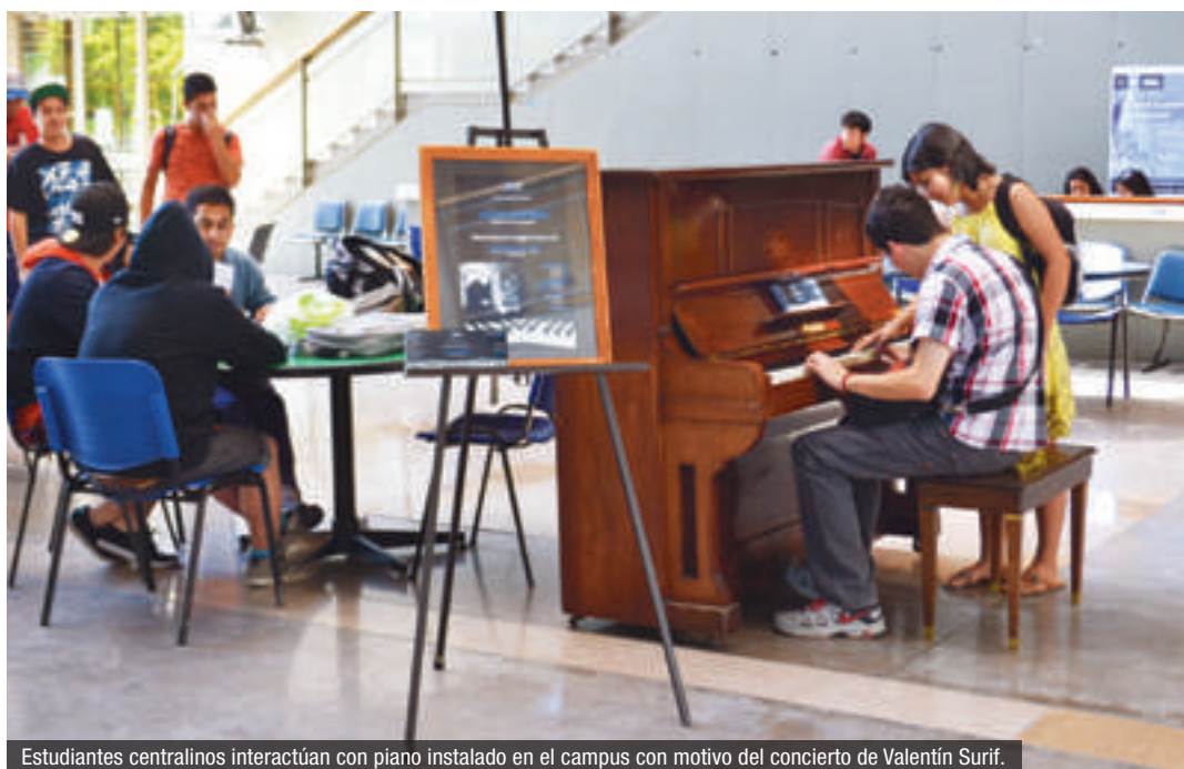
Estudiantes centralinos interactúan con piano instalado en el campus con motivo del concierto de Valentín Surif.

PARA DIFUNDIR EL EVENTO SE INSTALÓ EN DEPENDENCIAS DEL CAMPUS VICENTE KOVACEVIC, UN PIANO QUE PERMITIÓ ACERCAR EL INSTRUMENTO A LA COMUNIDAD POR MEDIO DE LA EJECUCIÓN LIBRE.