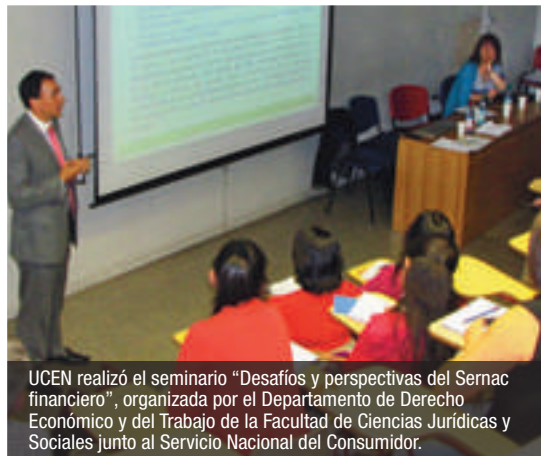
UCEN realizó el seminario "Desafíos y perspectivas del Sernac financiero", organizada por el Departamento de Derecho Económico y del Trabajo de la Facultad de Ciencias Jurídicas y Sociales junto al Servicio Nacional del Consumidor.