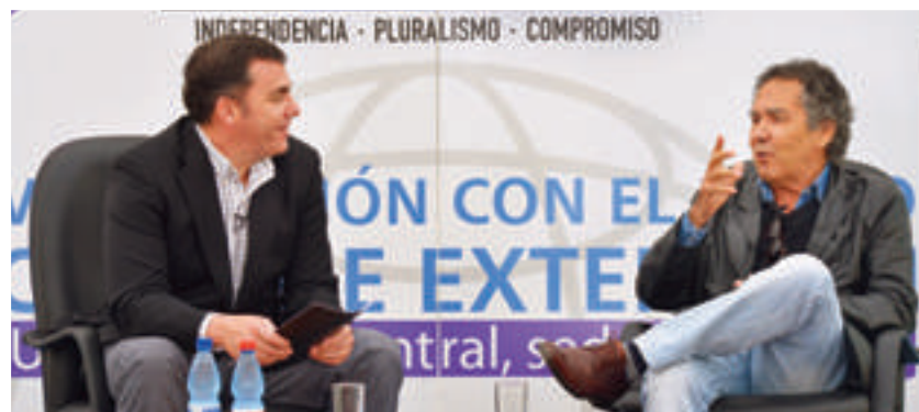
Con la humildad y la simpatía que lo caracteriza, el destacado escritor chileno, Hernán Rivera Letelier, cautivó a más de 200 personas en el marco del Ciclo de Extensión UCEN organizado por la Universidad Central, La Serena. Actividad que se enmarca en la conmemoración del 31º aniversario de la UCEN.