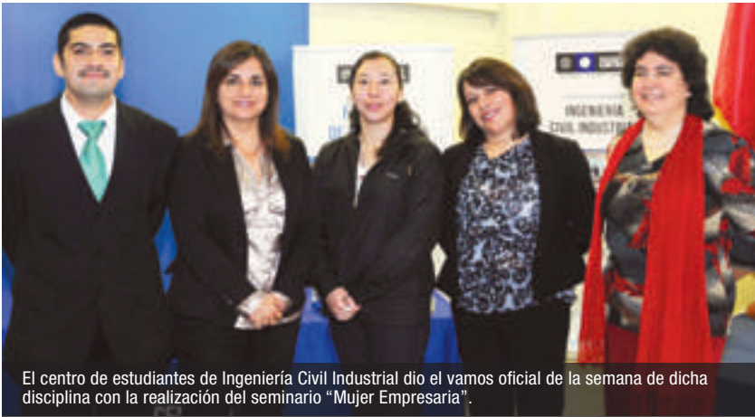
El centro de estudiantes de Ingeniería Civil Industrial dio el vamos oficial de la semana de dicha disciplina con la realización del seminario "Mujer Empresaria".