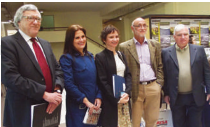
Con una alta convocatoria de representantes del mundo municipal, vecinal y académico, se realizó el simposio internacional "Diálogos para la sostenibilidad: La gestión en los gobiernos locales", organizado por los municipios de Santiago y Pudahuel junto a la Facultad de Arquitectura, Urbanismo y Paisaje.